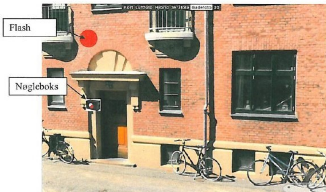
X gade nr. 45