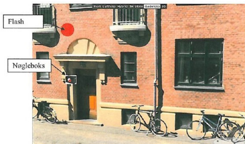
X gade nr. 45